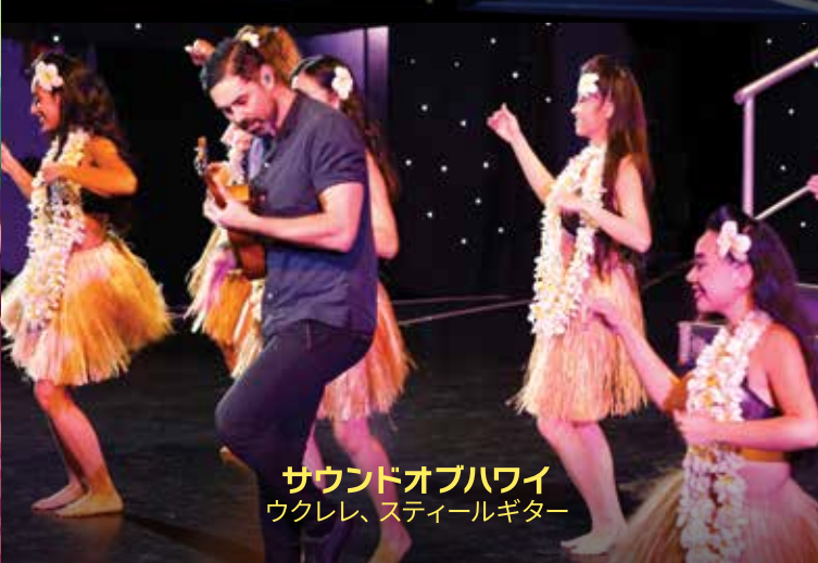
サウンドオブハワイ ウクレレ、スティールギター

ショーの後に 出演キャストと “ミート&グリート®” ロック・ア・フラ® オリジナル