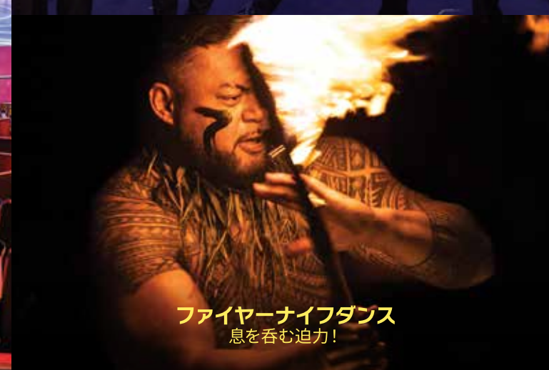
ファイヤーナイフダンス 息を呑む迫力！