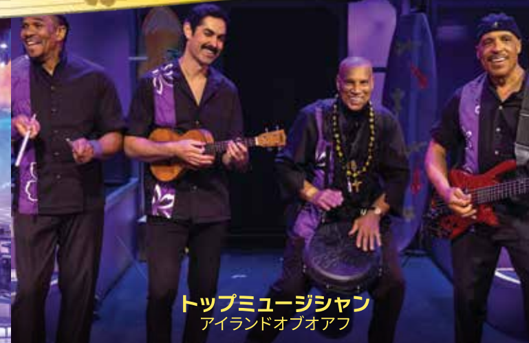
トップミュージシャン アイランドオブオアフ