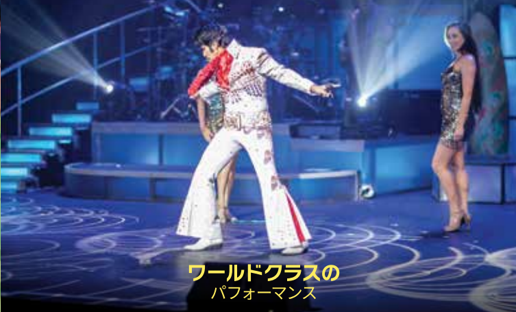
ワールドクラスの パフォーマンス