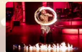
ファイヤーナイフダンス 息を呑む迫力!