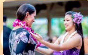
オーキッドレイのグリーティング マイタイ1杯&プレミアムドリンク1杯