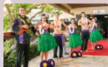
ルアウウェルカム&マイタイ1杯 楽しいワイキキの夜を始めよう