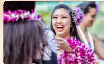
オーキッドレイのグリーティング マイタイ1杯&プレミアムドリンク1杯