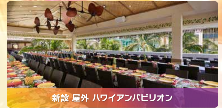
新設 屋外 ハワイアンパビリオン