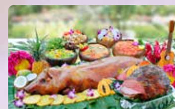
丸ごと豚のロースト& プライムローストビーフビュッフェ