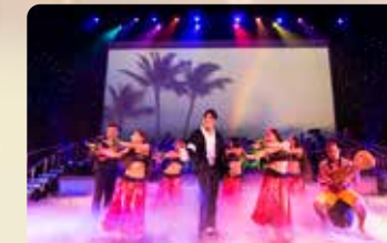
ハワイアンソング みんなで楽しめる