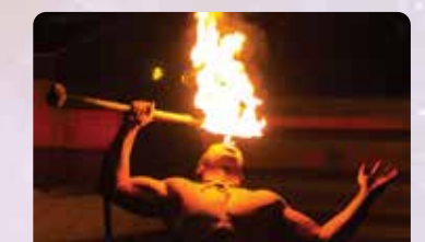
ワイキキの 熱い夜