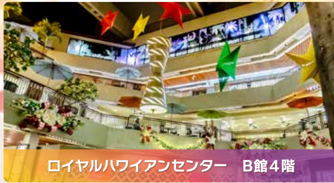
ロイヤルハワイアンセンター B館4階