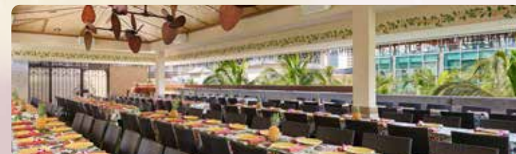
屋外ルアウダイニング 新設ハワイアンパビリオン