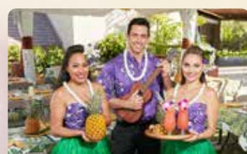
ルアウウェルカム&マイタイ1杯 アロハ溢れる夜