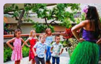
フラレッスン 体験してみよう