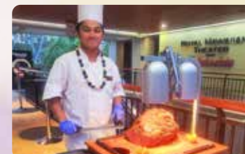
丸ごと豚のロースト& ローストビーフビュッフェ