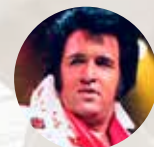
トラビス・パウウェル エルビス・プレスリー

“アロハカウア”（私からあなたへのアロハ）の心で、私たちオハナ（家族）が皆様をおもてなしするこの場所は、その昔ハワイのアリイ（王族）が癒しにきたところ。ショーの後はミート&グリート®で出演キャストと会って今息づく伝統のマジカルな思い出を。