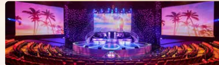
マジカルナイトはワイキキの中心で 屋外ルアウプレースから750席の豪華なプレミアシアターへ