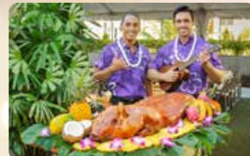
丸ごと豚のロースト& ローストビーフビュッフェ