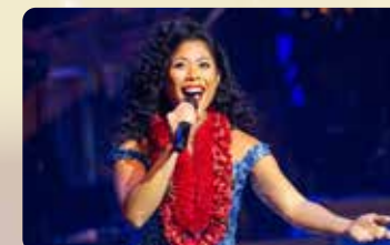
ハワイ出身 レコーディングアーティスト