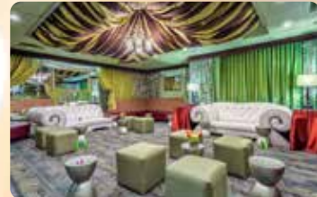
グリーンルーム® レセプション スパークリングワイン&写真(お2人に1枚)