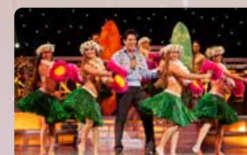
ワールドクラス ライブパフォーマンス