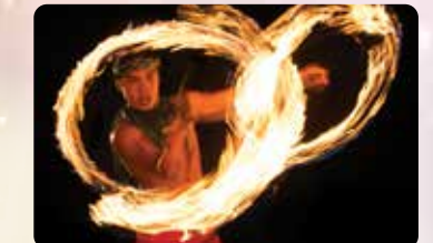
興奮のファイヤーナイフダンス VIP席にて