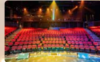
バックステージツアー シアターの舞台に立ちみよう!