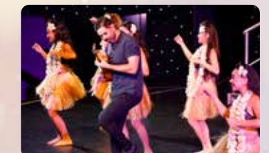
ウクレレパフォーマンス ハワイのサウンド