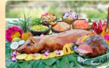
ルアウ優先席 屋外ハワイアンパビリオン