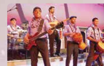
オアフのトップミュージシャン 懐かしのハワイアンサウンド