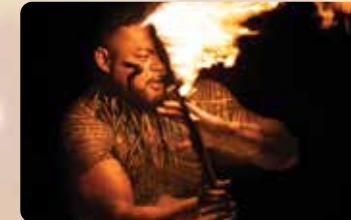
熱を感じるパフォーマンス 最高の席で