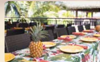
ルアウ優先席 屋外ハワイアンパビリオン