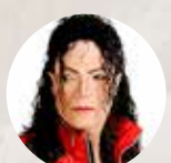
ウィリアム・ホール マイケル・ジャクソン