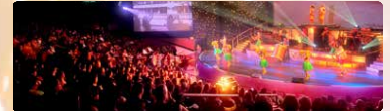
ワイキキ最大のハワイアンショー®を750席シアターで 究極のシアター体験を