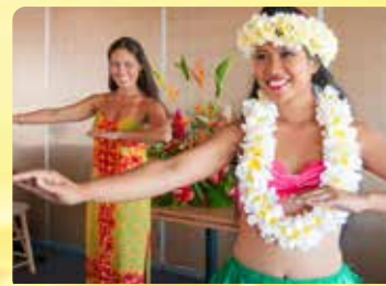
ポリネシアンショー & フラレッスン