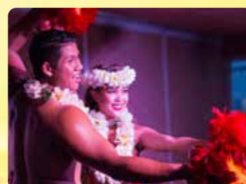
ポリネシアンショー カラフルなショー