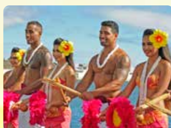
ピアサイドウェルカムフラ 美しいフラダンサー達

PACIFIC STAR パシフィックスター サンセットビュッフェ & ショー® 楽しいトロピカルナイト 5:30~7:30PM 下船