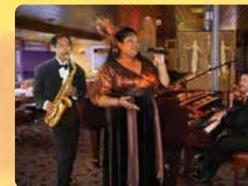
ライブジャズエンターテイメント オアフのトップアーティストトリオ