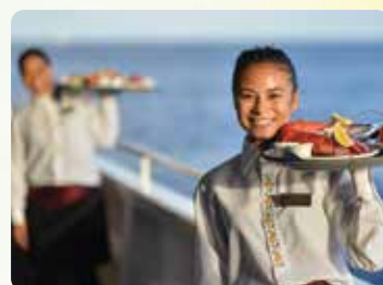
産地直送 丸ごとメインロブスター