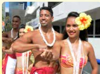
ピアサイド ウェルカムフラ 美しいフラダンサー達