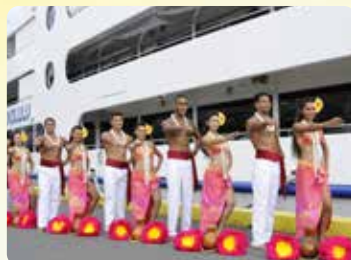
ピアサイドウェルカムフラ & ボンボヤージュ・フラ