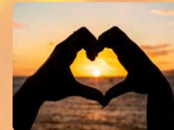
感動的なサンセット 高さ18.2mのプライベートラナイ