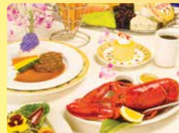
5コース丸ごとメインロブスター & テンダーロインビーフディナー