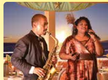
ライブジャズ演奏 お食事中のBGMに