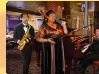
ライブジャズエンターテイメント オアフのトップアーティストトリオ