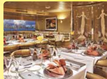
スーパーノバルーム 最上階の360°パノラマビュー