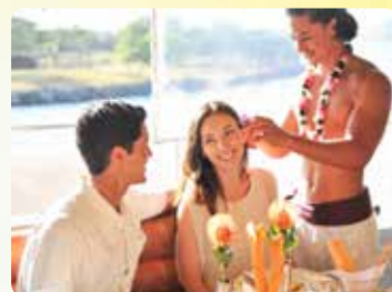
ボンボヤージュフラ 楽しい夜の幕開け