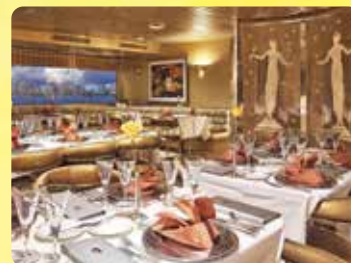
スーパーノバルーム 最上階の360°パノラマビュー