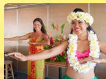
フラレスン ダンサーと一緒に