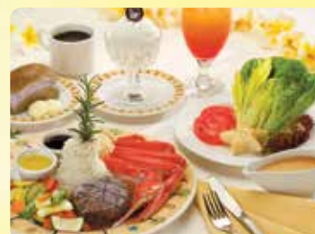
3コース カニ テンダーロインビーフ & BBQチキンディナー