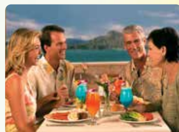
スターシグネチャーマイタイ1杯 & ボンボヤージュ・フラ