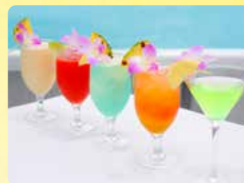
スパークリングワインの乾杯 & プレミアムドリンク2杯