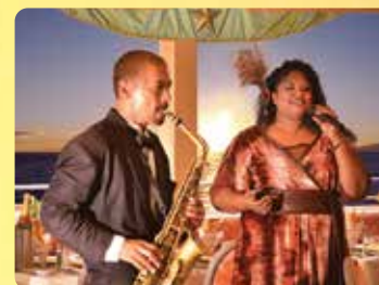
ライブジャズ演奏 お食事中的BGMに