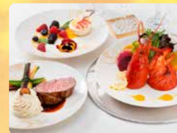
5コースシングネチャーディナー メインロブスター & プライムテンダーロインビーフ