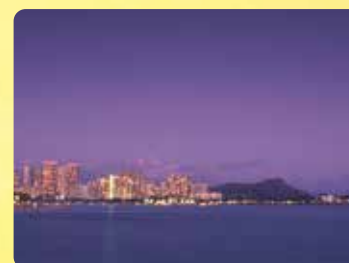
360°パノラマビュー 高さ18.2mの展望サンデッキで