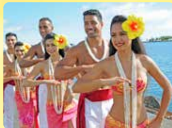
ウェルカムフラ 乗船時のお出迎え

シグネチャーディナーと360°パノラマビュー 5:30~7:45PM 下船 木曜日、金曜日、土曜日 運航