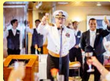
スパークリングワインで乾杯 キャプテンと一緒に