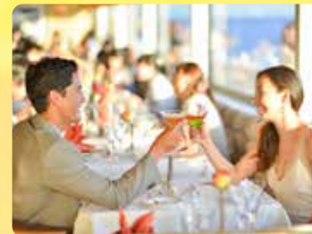
プライベートテーブル スーパープレミアムドリンク2杯