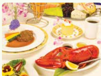
5コース丸ごとメインロブスター & テンダーロインビーフディナー