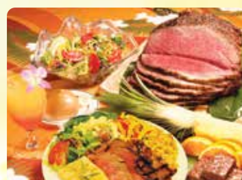
プライムローストビーフビュッフェ ディナー&スターシングネチャーマイタイ1杯