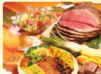
プライムローストビーフピュッフェ ディナー&スターシグネチャーマイタイ1杯