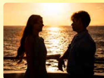
美しいサンセット マジカルな絶景を捉えよう