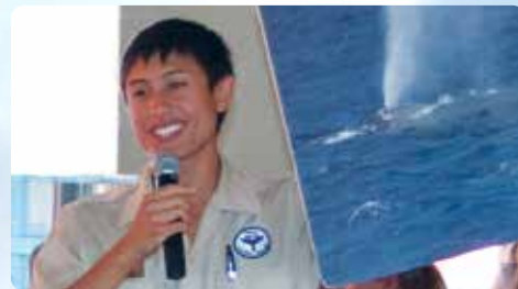
ナチュラリストのデモンストレーション クジラについて楽しく学べる