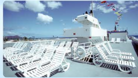
高さ18.2mの展望サンデッキ 360°のパノラマビュー