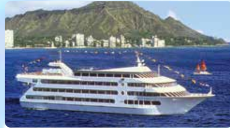
数々の賞に輝くスター号 ホエールウォッチに最適