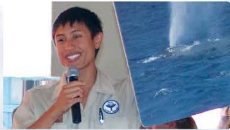
ナチュラリストのデモンストレーション クジラについて楽しく学べる