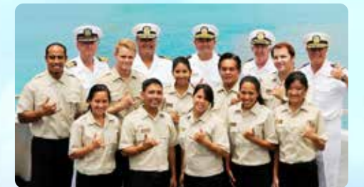
ナチュラリストの資格を持ったクルー 皆様の乗船を歓迎