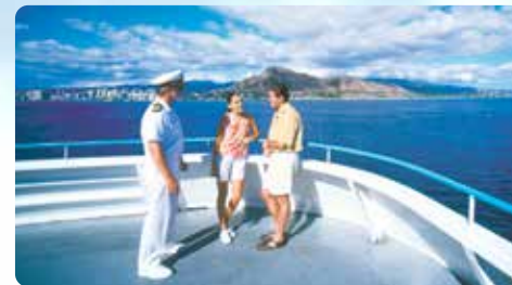
広い屋外スペース ザトウクジラ観察に最適