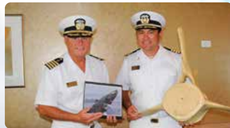
キャプテン2名が乗船 スター号ならではのホエールウォッチ