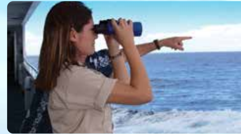
4つの散策デッキ クジラを見つけよう