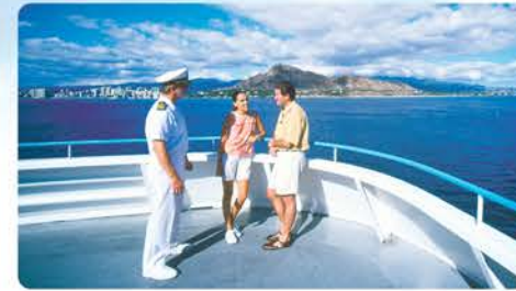
広い屋外スペース ザトウクジラ観察に最適