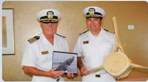
キャプテン2名が乗船 スター号ならではのホエールウォッチ