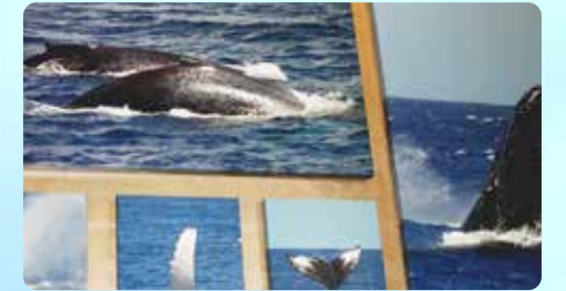
ホエールギャラリー スナック、カクテルバー付き