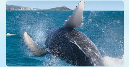
雄大なザトウクジラ 冬ならではのエコツアー