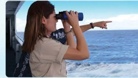
4つの散策デッキ クジラを見つけよう