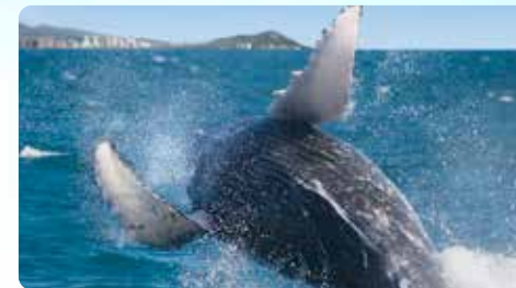
雄大なザトウクジラ クジラが見える保証付き