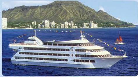
数々の賞に輝くスター号 3種の安定装置付き