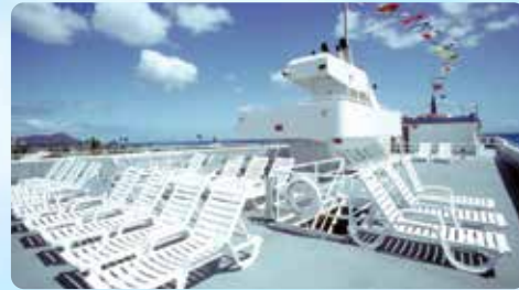
高さ18.2mの展望サンデッキ 360°のパノラマビュー