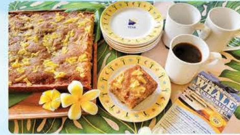
ハワイの朝のコーヒー ホームメイドのバイナップルバナナブレッドと