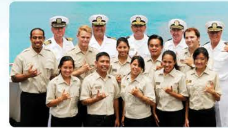
ナチュラリストの資格を持ったクルー 皆様の乗船を歓迎