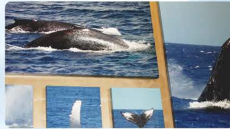
ホエールギャラリー スナック、カクテルバー付き