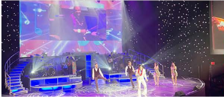
最先端のテクノロジー