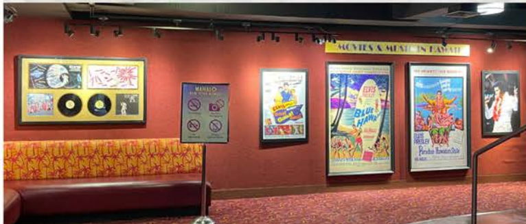
シアターギャラリー