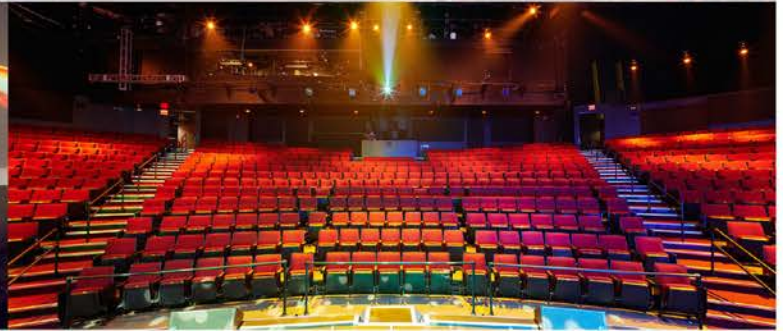
ワイキキ中心の750席プレミアシアター