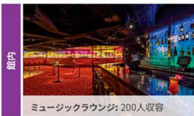
ミュージックラウンジ: 200人収容