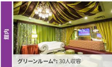
グリーンルーム®: 30人収容