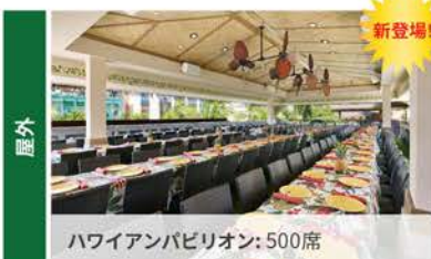
ハワイアンパビリオン: 500席