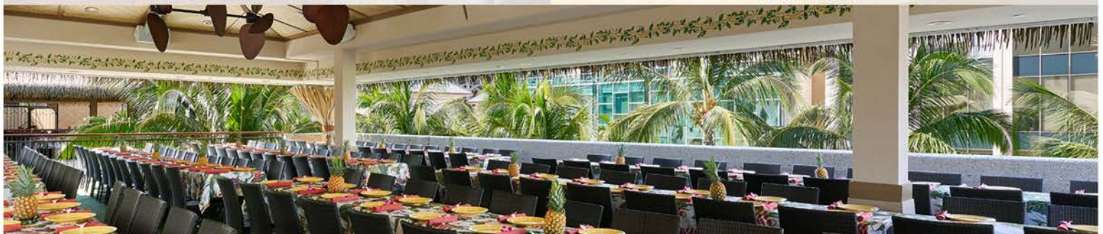
屋外茅葺き屋根のハワイアンバビリオン2棟