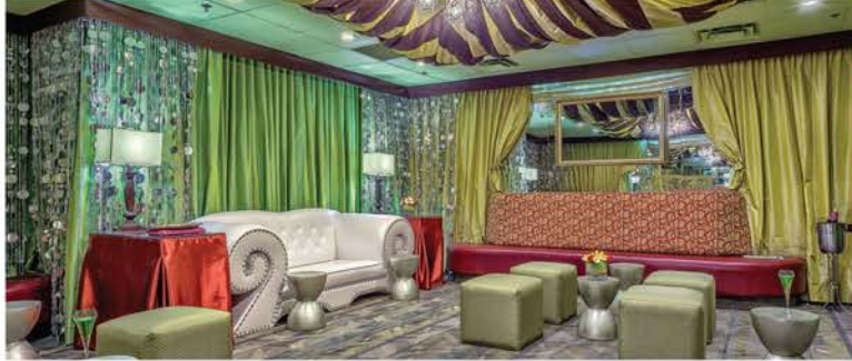
バックステージグリーンルーム®