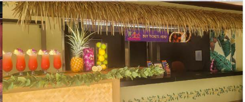
屋外カクテルエリア