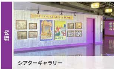
シアターギャラリー