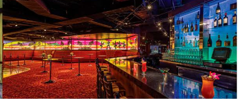
ミュージックラウンジ