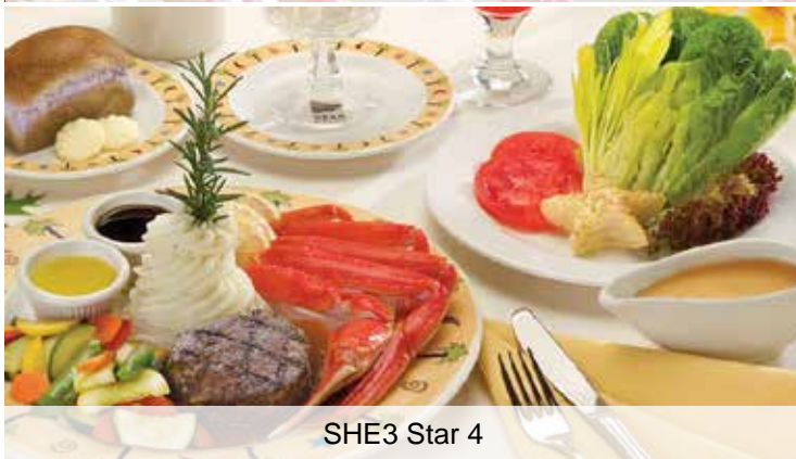
SHE3 Star 4