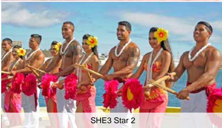
SHE3 Star 2