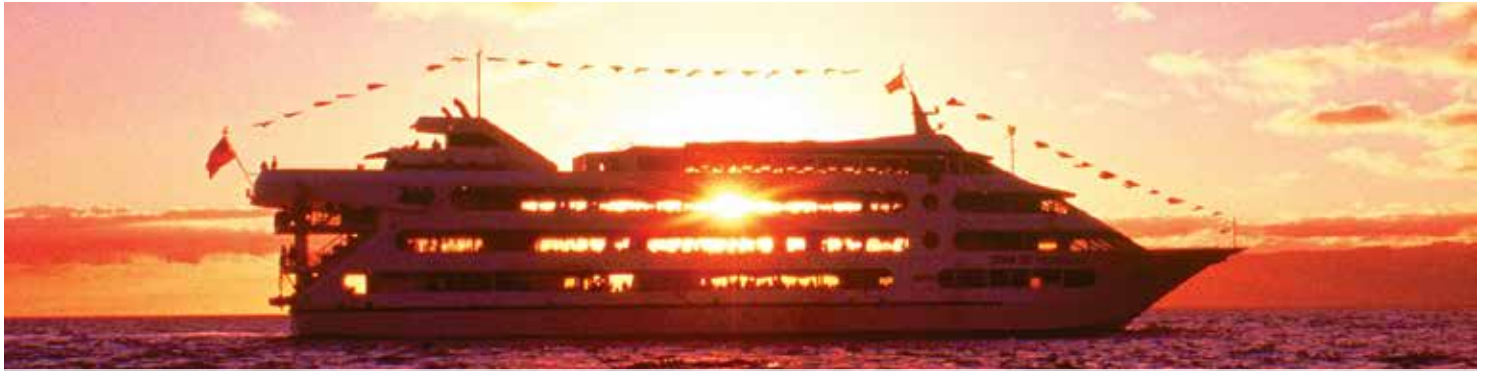
SHE3 Star 1

Preview our library and download full-size, high-resolution images at StarofHonolulu.com/Travel-Partners-Images .