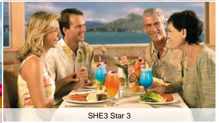
SHE3 Star 3