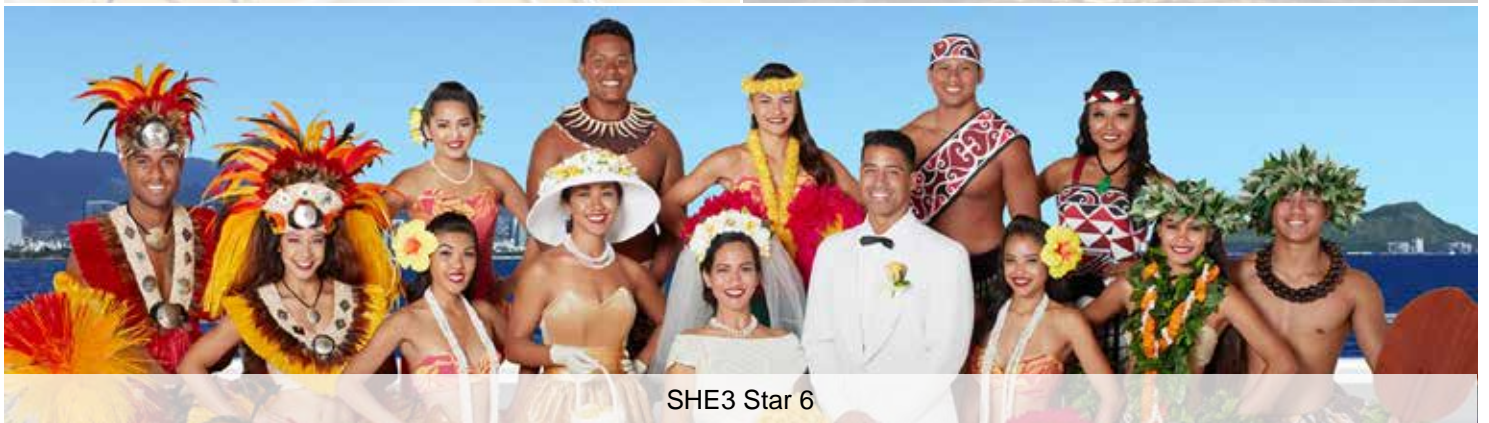
SHE3 Star 6

All images & video are copyrighted; any use must expressly provide photo credit to Star of Honolulu Cruises & Events®.